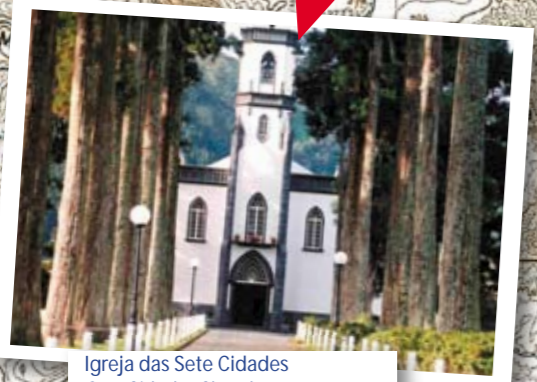
Igreja das Sete Cidades Sete Cidades Church