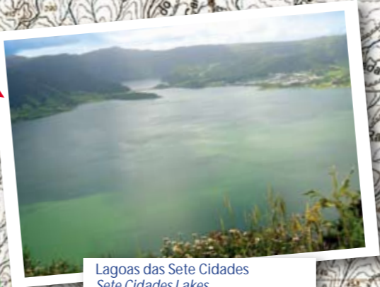
Lagoas das Sete Cidades Sete Cidades Lakes

circuito pedestre / walking trail Mata do Canário Sete Cidades Ilha de S. Miguel / S. Miguel island