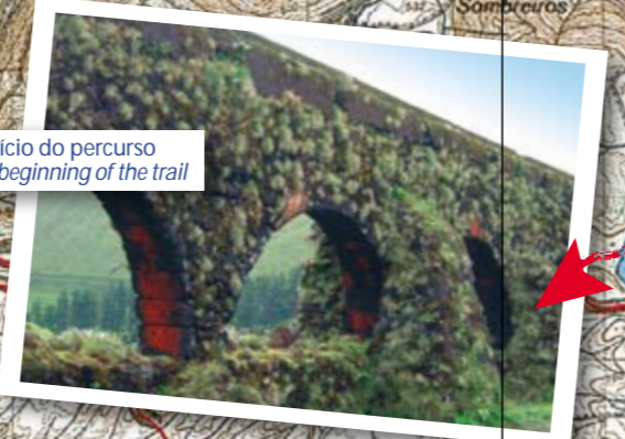
Aqueduto no início do percurso Aqueduct at the beginning of the trail